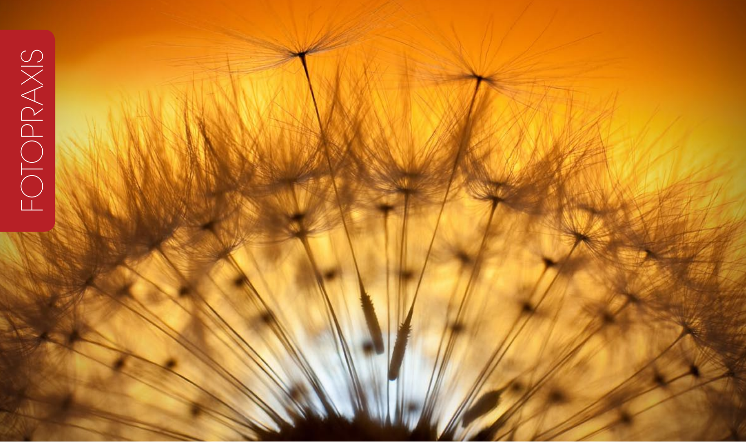
Abbildung 3: Ein weiteres Pustelblumbild. Bildtitel: „Just the two of us ...!“