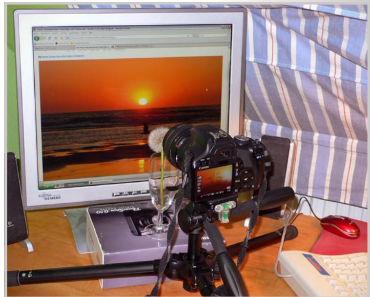
Abbildung 4: Das Setup zum zweiten Blumenfoto mit Sonnenuntergang. Av-Modus, tv = 2 Sekunden, Blende 8, Belichtungskorrektur = +0,67 EV, Gain = ISO 100. Objektiv: Canon EF 50 mm f/1.4 an Canon APS-C-Kamera.

Einige Worte noch zur Flickr Frontpage: Wie die Wahl der Frontpage-Fotos genau vonstatten geht, das liegt noch im Dunkeln, aber wenn